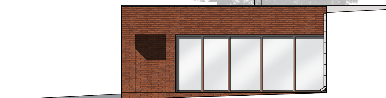
ELEWACJA WSCHODNIA DZIEDZINIEC 2