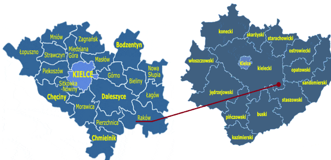
Rysunek 1 Lokalizacja Gminy Raków na mapach powiatu kieleckiego oraz województwa świętokrzyskiego