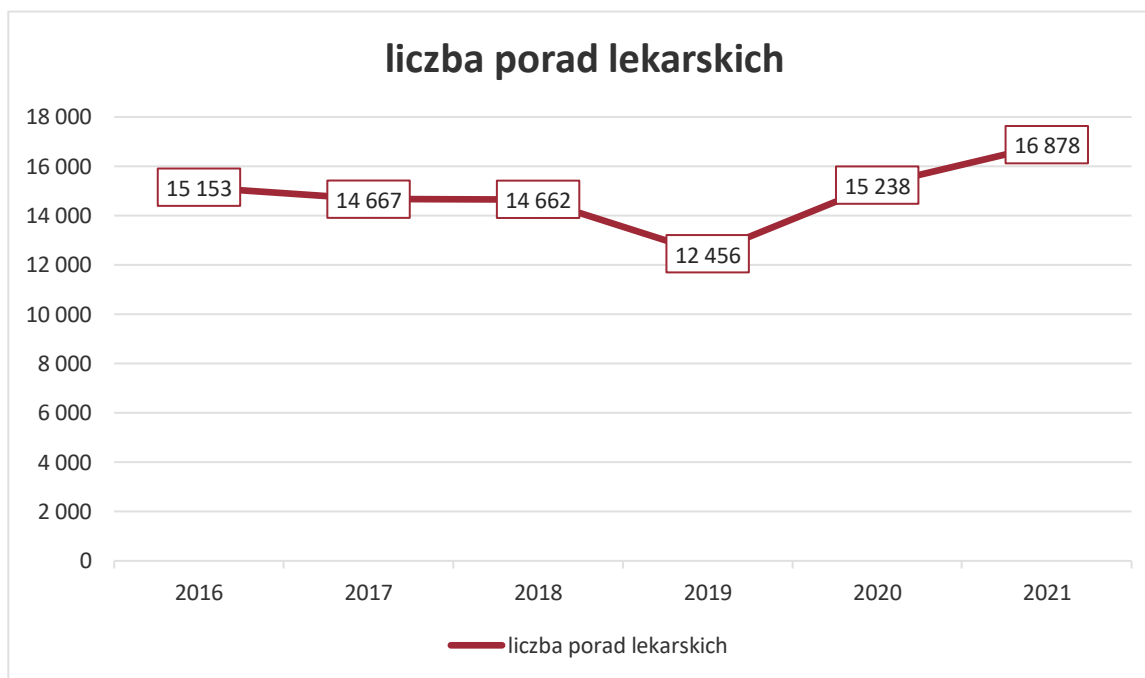
Wykres 2 Liczba porad lekarskich w Gminie Raków w latach 2016-2021

Źródło: opracowanie własne na podstawie danych BDL GUS (dostęp: 30.06.2022 r.)